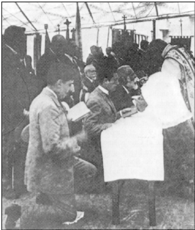
Gaudí recibiendo la comunión en una misa de expiación de la blasfemia celebrada bajo un entoldado provisional, donde ahora se alzan las naves de la Sagrada Familia.