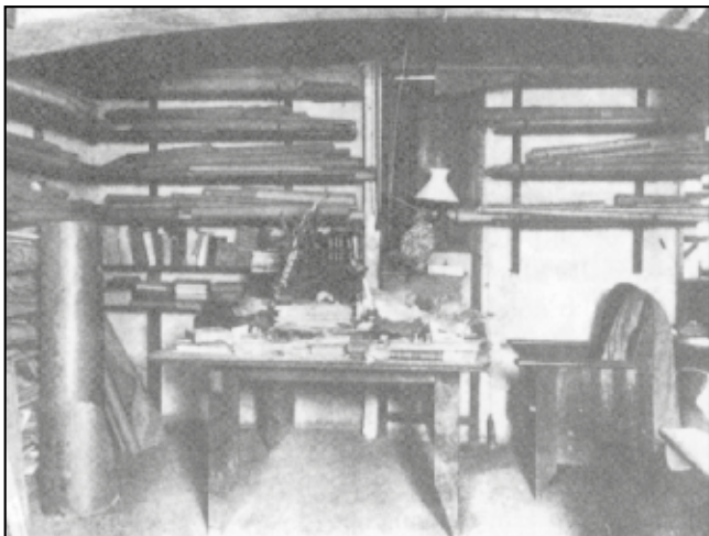
Taller de Gaudí. Mesa de despacho donde habitualmente tenía lugar su frugal almuerzo.

Se iba a cumplir así uno de los deseos que algunas veces había manifestado Gaudí: Morir pobre en un hospital de