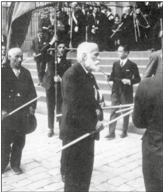
Antoni Gaudí saliendo de la catedral de Barcelona, en la procesión del Corpus Christi de 1924, cuando contaba setenta y dos años de edad