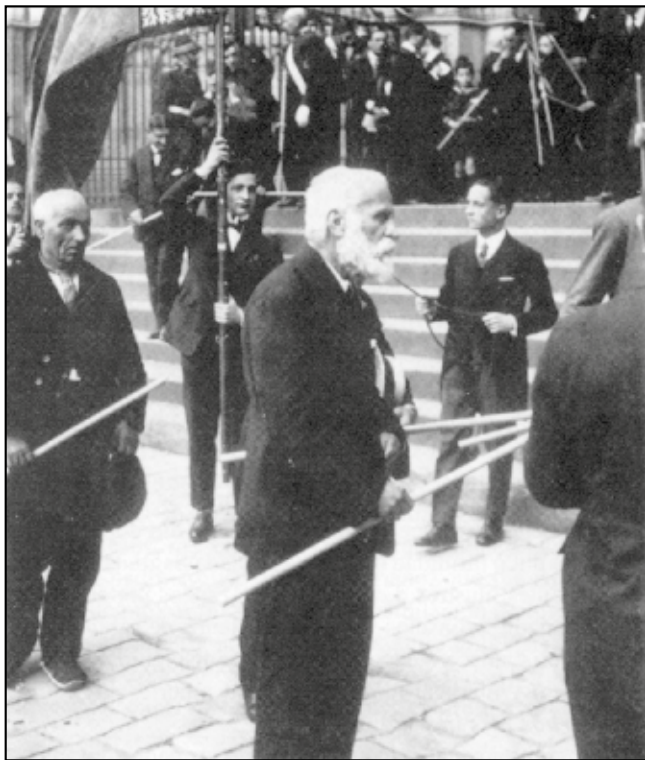
Si Antoni Gaudi habang nililisan ang Katedral ng Barcelona, sa prosesyon ng Corpus Christi 1924, nang siya ay 72 taong gulang.