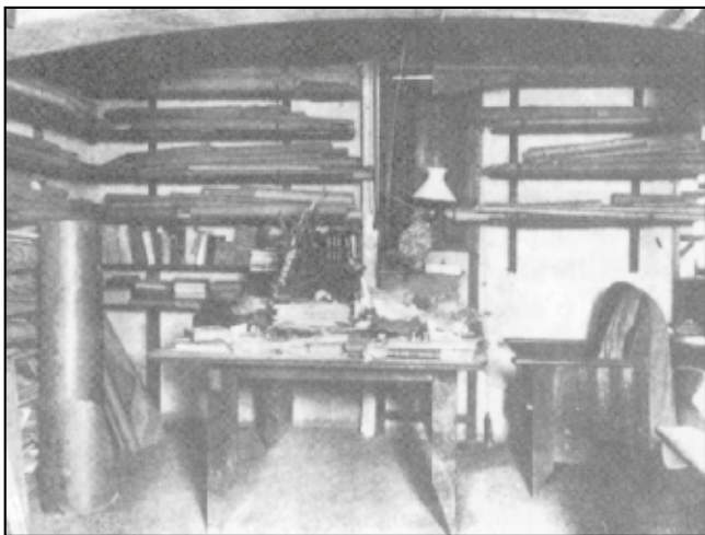
Lugar pagawaan ni Gaudi: Ang mesa kung saan siya parating kumakain ng payak na pananghalian.

ang kanyang simpleng pamumuhay sa panalangin, pagpepeni- tensiya at pagsawawalang-bahala sa mga materyal na bagay. Siya ay nagbuhay mahirap at naging isang tambay sa kalsada na humihingi ng donasyon para sa pagpapatayo ng Sagrada Familia. Sa huling ikatlong bahagi ng kanyang buhay, matapos mag-asiste sa misa sa alas-singko y media ng hapon, siya ay naglakad mag-isa patungong simbahan ng Sant Felip Neri, malapit sa Catedrál para sa kanyang mga personal na panalan- gin at nakipag-usap sa kanyang espirituwal na direktor.