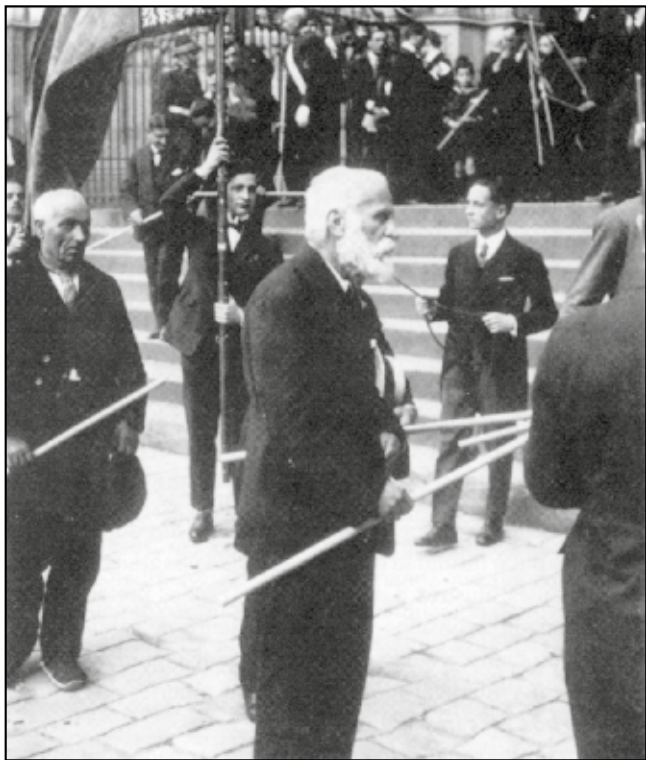
Si Antoni Gaudi habang nililisan ang Katedral ng Barcelona, sa prosesyon ng Corpus Christi 1924, nang siya ay 72 taong gulang.