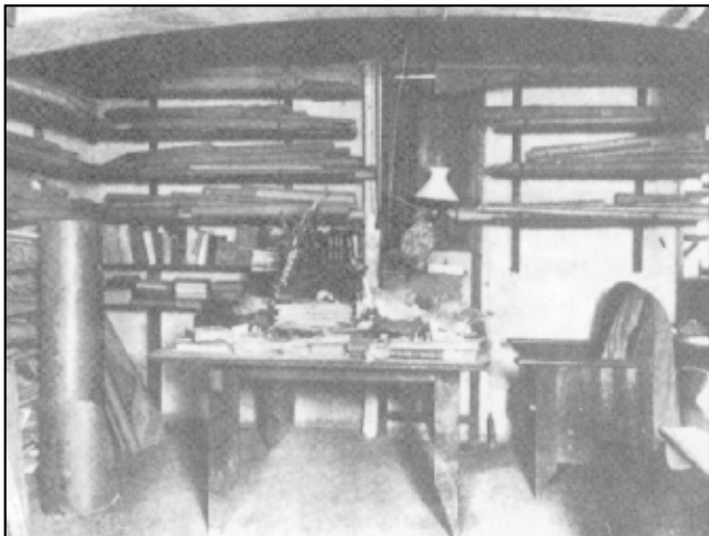
Мастерская Гауди. Рабочий стол, за которым он часто обедал, при этом очень скромно.

материальных благ. Живя в бедности, он стал просить милостыню у любого для продолжения строительства Святого Семейства. В течение последней трети своей жизни он обычно присутствовал на мессе, потом находился на стройке до половины шестого, а затем пешком шел в церковь Святого Филиппа Нери совсем рядом с Храмом. Там он произносил свою личную молитву и говорил со своим духовным руководителем.