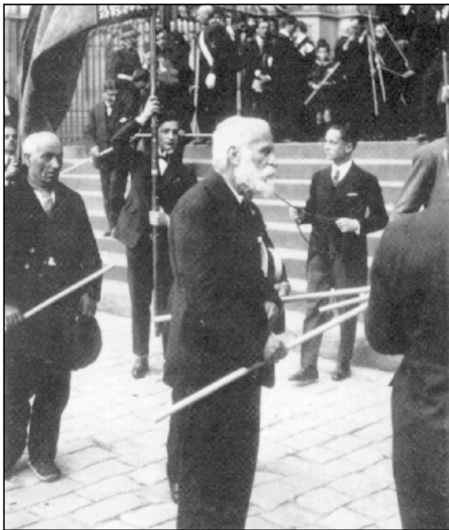
Антонио Гауди, в возрасте 72 лет, выходящий из собора Барселоны, во время праздника Тела и Крови Христова, 1924 год.