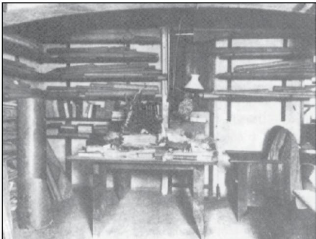
Gaudí műterme a Sagrada Familiában. Ez volt a rajasztala, itt szokta elfogyasztani szerény ebédjét is.

1910-ben a Colonia Güell-ben (a Barcelona mellett felépült Güell-faluban) került megrendezésre a „Keresztényszociális Hét”, melyen több egyházi vezető is részt vett. A vendégek meglepetéssel Eusebi Güell úr (Gaudí támogatója, mecénása, barátja és egyben megbízója) gyárát, a hozzá épített munkásfalut és a falu templomának Gaudí által addigra már felépített altemplomát is.