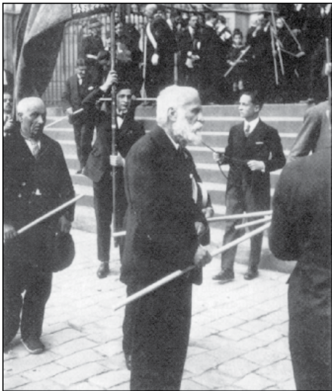
Antoni Gaudí 1924-ben, 72 éves korában, az Úrnapi körmenetben a Barcelonai Székesegyház előtt.