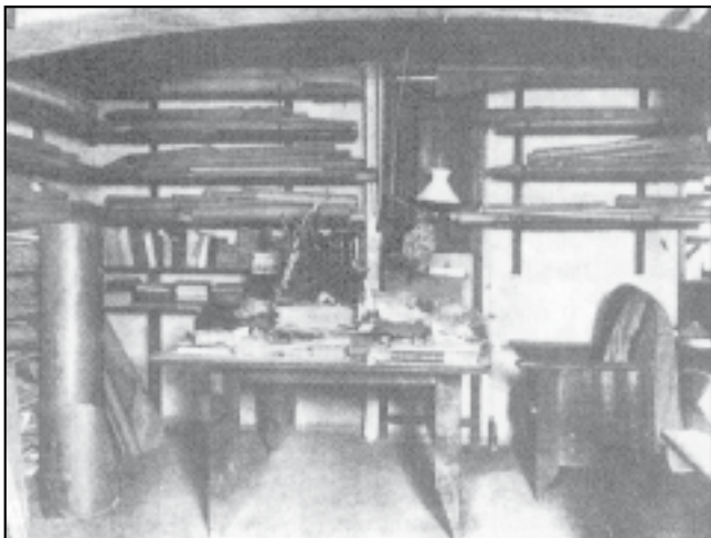
Gaudíjeva delavnica. Na tej delovni mizi je običajno tudi skromno poobedoval.

Zgodilo se je, kot je želel in nekajkrat izrazil Gaudí: Umreti reven v bolnišnici krščanskega usmiljenja, sprejet le iz ljubezni do Boga. Prejel je bolniško maziljenje, naslednji dan je obdan od najbližjih pri polni zavesti prejel zelo zbran sveto popotnico in spregovoril nekaj besed. Umrl je dva dneva pozneje, 10. junija 1926, ko je izrekel poslednje besede: »Amen. Moj Bog. Moj Bog.«