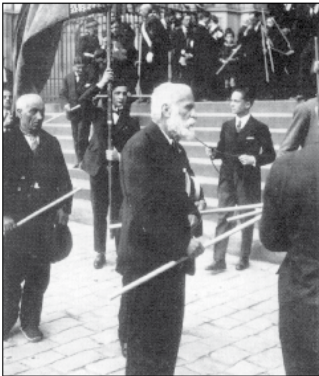
Antoni Gaudí med procesijo Svetega Rešnjega Telesa pred katedralo v Barceloni leta 1924; star je 72 let.