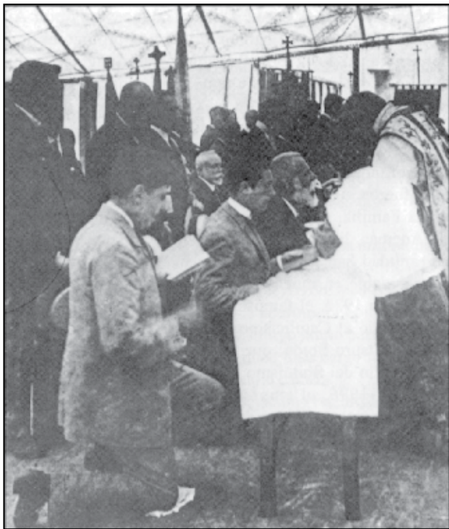
Gaudí rep la comunió en una missa d'expiació de la blasfèmia, sota un envelat provisional al lloc on ara s'aixequen les naus de la Sagrada Família.