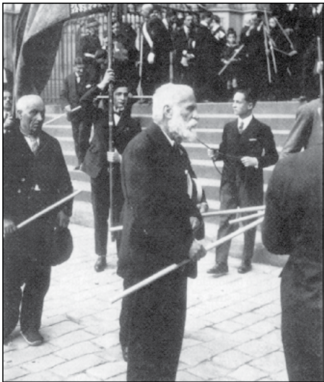
Antoni Gaudí sortint de la catedral de Barcelona, a la processó de Corpus Christi de 1924, quan tenia setanta-dos anys d'edat.