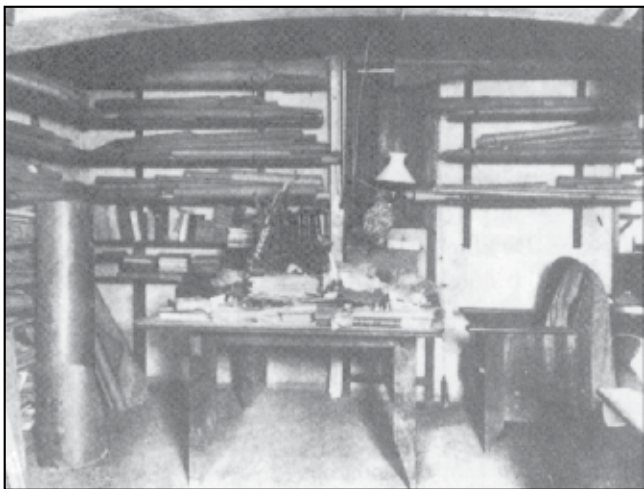
Taller de Gaudí. Taula del despatx, on habitualment prenia el seu frugal dinar.

cació de la Sagrada Família. En aquests seus darrers anys, després d'oïr la santa missa, solia passar tota la jornada a peu d'obra, fins a dos quarts de sis de la tarda. Aleshores anava caminant a l'església de Sant Felip Neri, molt a prop de la catedral. Allà feia l'oració personal i conversava amb el seu director espiritual.